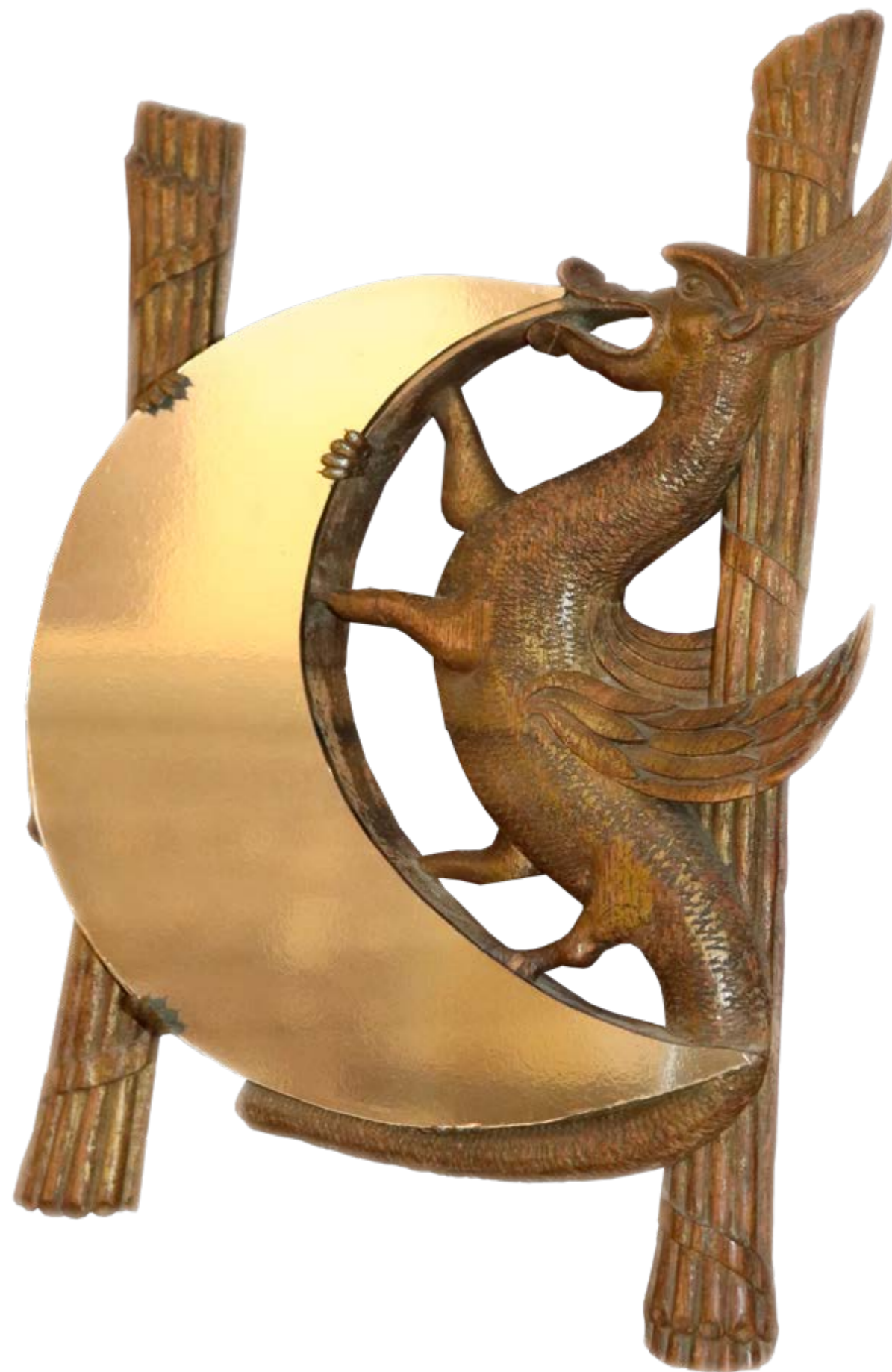
Дракон пожирающий луну

Указом Коллегии иностранных дел разрешение регулярного менового торга с казахами в Семипалатинской и Ямышевской крепостях было дано 28 июня 1753 года. Сибирская администрация намеревалась концентрировать здесь обмен товарами с казахами восточных районов Среднего жуза. На левом берегу Иртыша, напротив Павлодара было организовано, так называемое Меновое. Основную массу казахского привоза на