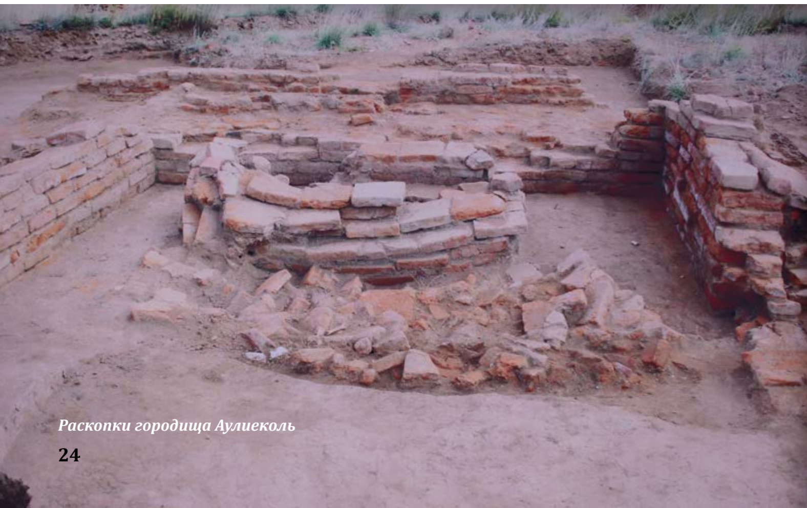
Раскопки городища Аулиеколь