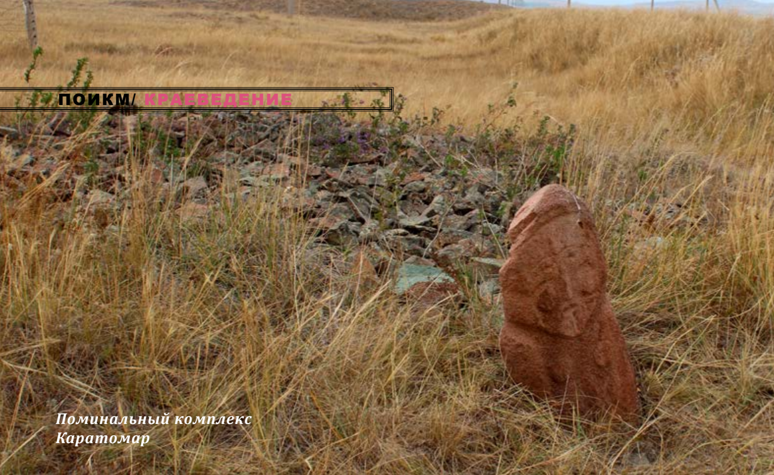
Поминальный комплекс Каратомар

ное количество людей присутствующих на поминках, однако связывать поминально-ритуальное сооружение в качестве исключительно утилитарного свойства в виде банальной коновязи вряд ли справедливо. К тому же, на некоторых мемориальных ком-