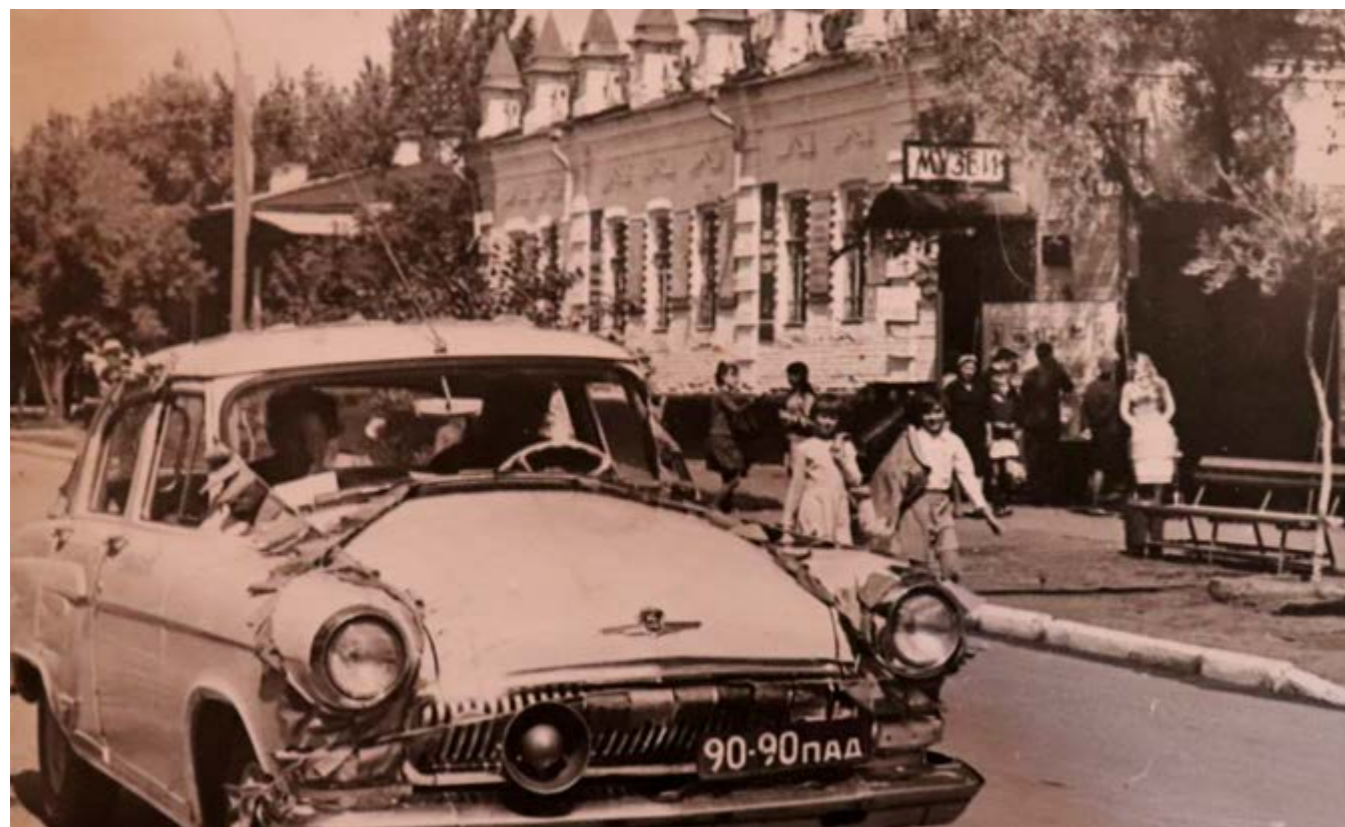
Первое здание музея