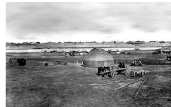
Меновое поле, начало XX века

Меновое составлял скот. Кроме скота в составе казахского привоза были меха, мерлушка, овчина, войлоки, кошма, верблюжья шерсть. В такой торговле участвовали русские крестьяне и зажиточные казаки, продавая, в обмен на предметы кочевого производства, хлеб, чай, бумажную материю. Из соседнего Бийского округа и ближайших уездов Семиречья в пределы области привозились зерновой хлеб, мука, крупа, овес, сельские ремесленные изделия, а из внутренней России - мануфактура и другие товары. На внутренние сибирские рынки вывозили лошадей, рогатый скот, овец, продукты животноводства - кожу, сало, шерсть. Из казачьих станиц на рынок поставлялись рыба, рыбий жир, огородные овощи, воск, кедровые орехи, лесной материал: бревна, жерди, дрова.