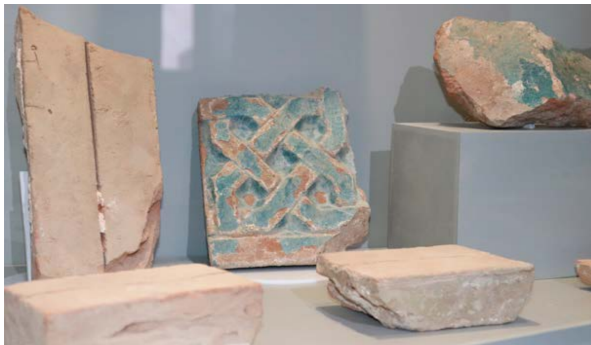
Фрагменты мавзолея XIV-XV вв. в экспозиции музея «Ertis»

Полихромная плитка стала декоративным элементом архитектуры конца XIV-XV вв. Теперь, помимо фигурной кладки из кирпичей, монотонные фасады стали украшаться поливными изразцами. В среднеазиатском культовом строительстве расцвет нового стиля, названного историками архитектуры бирюзовым, относится к эпохе Тимура. Тимуридская культура охватывает время правления Тимура и его преемников: последняя четверть XIV — конец XV в. Впервые в степной зоне, далекой от оседлых земледельческих регионов Центральной Азии открыт культовый объект столь совершенного дизайна. Даже сохранившиеся доныне степные мемориалы Улытау — мавзолеи Жоши хана и Алаша хана построены просто из жженого кирпича без полихромного оформления. Узор на бирюзовых плитках мавзолея Жанибек Шалкар перекликается с полихромной мозаикой культовых строений столицы Золотой Орды — г. Сарайчика и столицы Эмира Тимура — г. Самарканда. Архитектурные детали и бирюзовый стиль не оставляют сомнения в датировке мавзолея Жанибек Шалкар концом XIV — началом XV в.