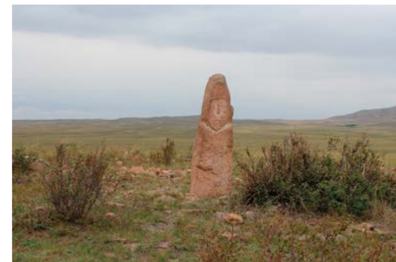
Изваяние в окрестностях а. Шоманколь

Значительное количество памятников этого периода представлены парными изваяниями, из которых одно мужское, оно как правило больше по размерам, второе женское. Все они располагаются вблизи ручьев или речек.