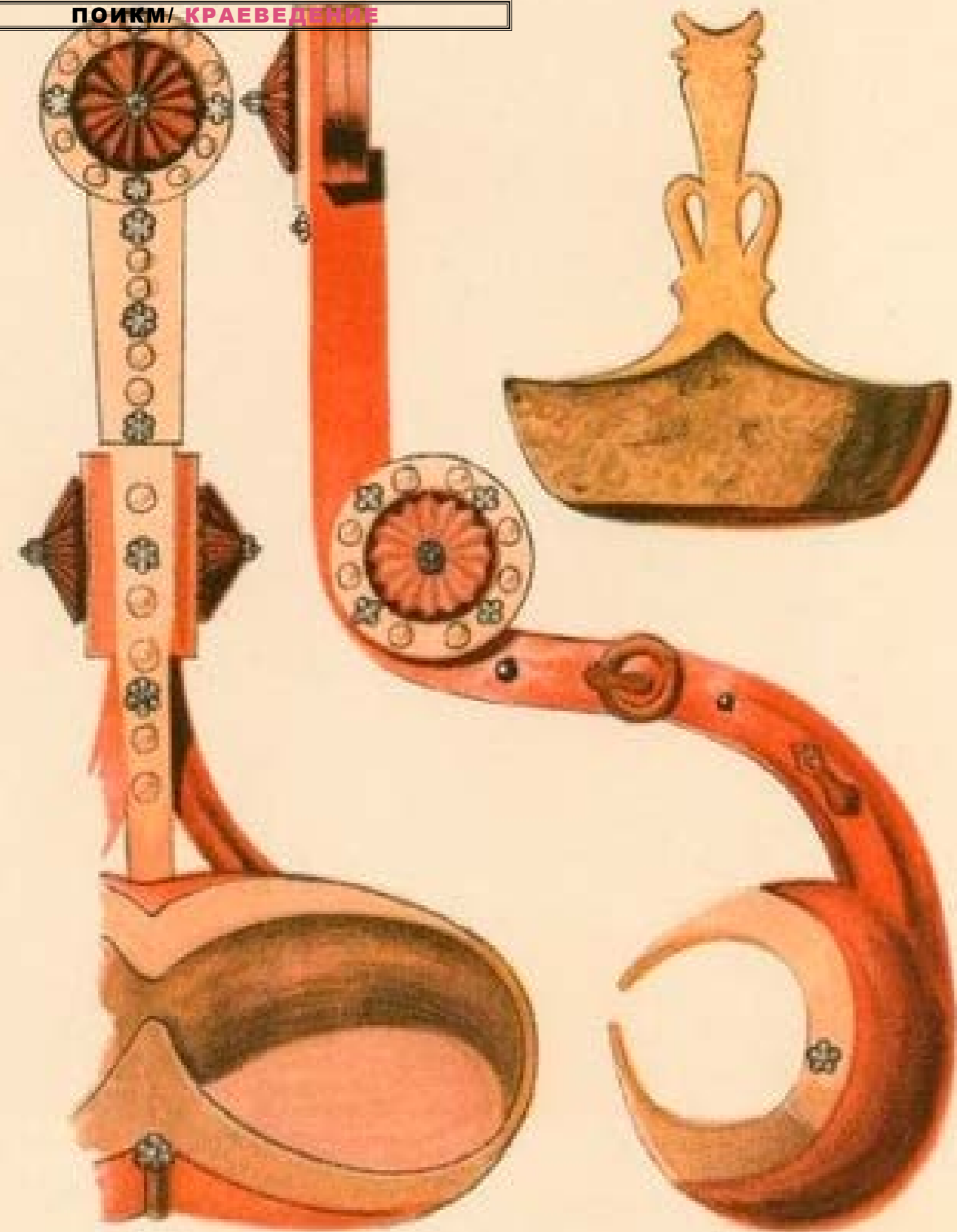
Зарисовки казахского орнамента, сделанные Е.А. Клодтом, 1939г.

ных его районах. По заданию музея г. Омска Е.А. Клодт тщательно скопировал большую серию типичных для Северного Казахстана орнаментов. Сравнение с рядом подлинных произведений казахского народного творчества показывает, что зарисовки Е.А. Клодта очень близки к оригиналам.