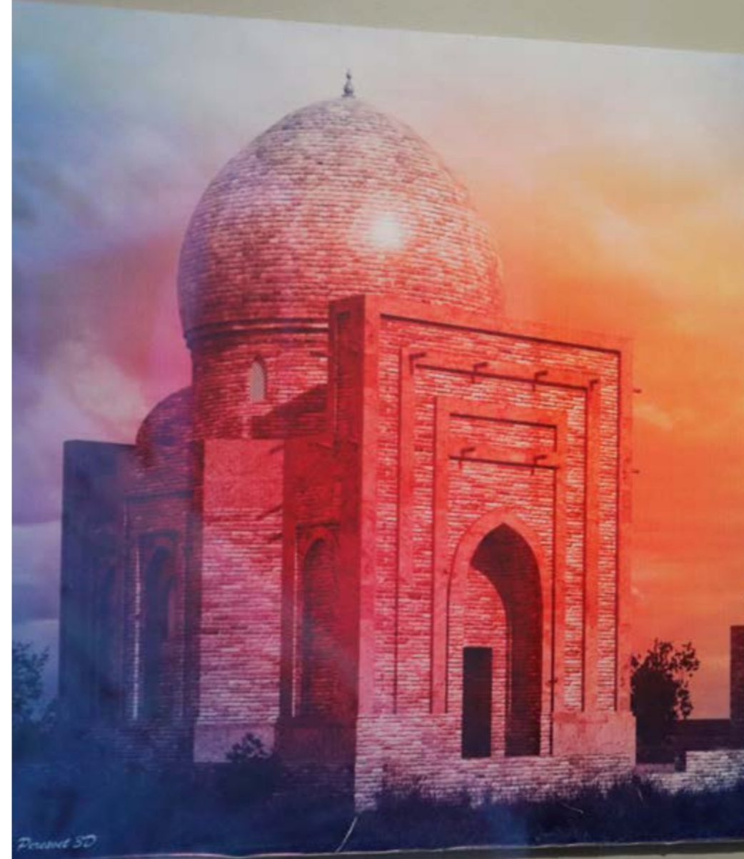
Реконструкция мавзоля XIV-XV вв.

родилась в Баянаульских горах. Так как она родилась там, гору эту назвали «Баянаула». Горы, где она уронила свой головной убор «Каркара» были названы «Каркаралы-Казылык». Место, где она оставила свою домбыру и ожерелье было названо «Домбыралы», «Моншақлы». Там где был оставлен сундук красавицы «Алтынсандық», «Ақшатау». Места, где она проводила веселые дни и пела песни было названо «Өлеңті». Место, где упали конские путы были названы «Шідерті». Полагаясь на данные источники в общем все названия Сарыарки – остались от наших предков-казахов». Среди автохтонного насе-