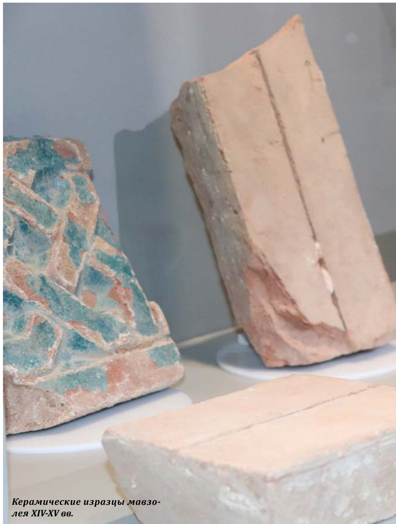
Керамические изразцы мавзо- ля XIV-XV вв.