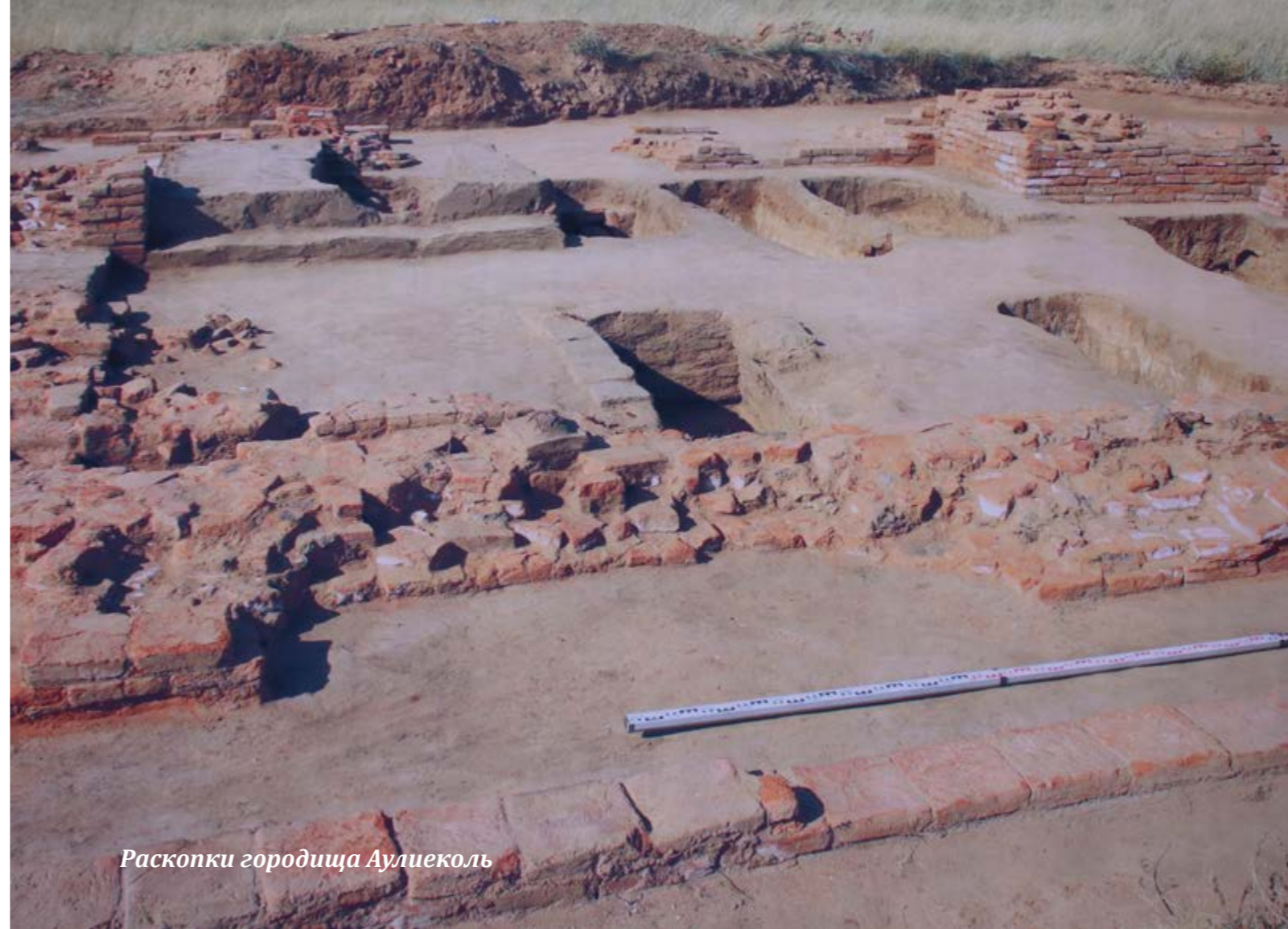
Раскопки городища Аулиеколь

История памятника Бозок тесно связана с историей становления Нур-Султана как столицы. Все началось в 1997 году, когда с переносом столицы в центр Казахстана, встала задача изучения древностей Сарыарки. Существование этого памятника было известно по публикациям и архивным источникам, однако поиски его были довольно продолжительными. Осенью 1998 года памятник