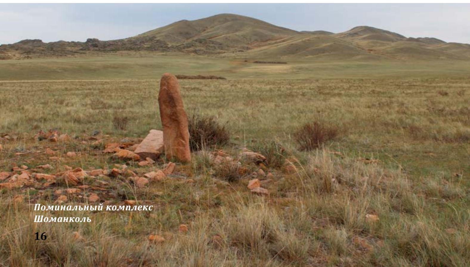
Поминальный комплекс Шоманколь