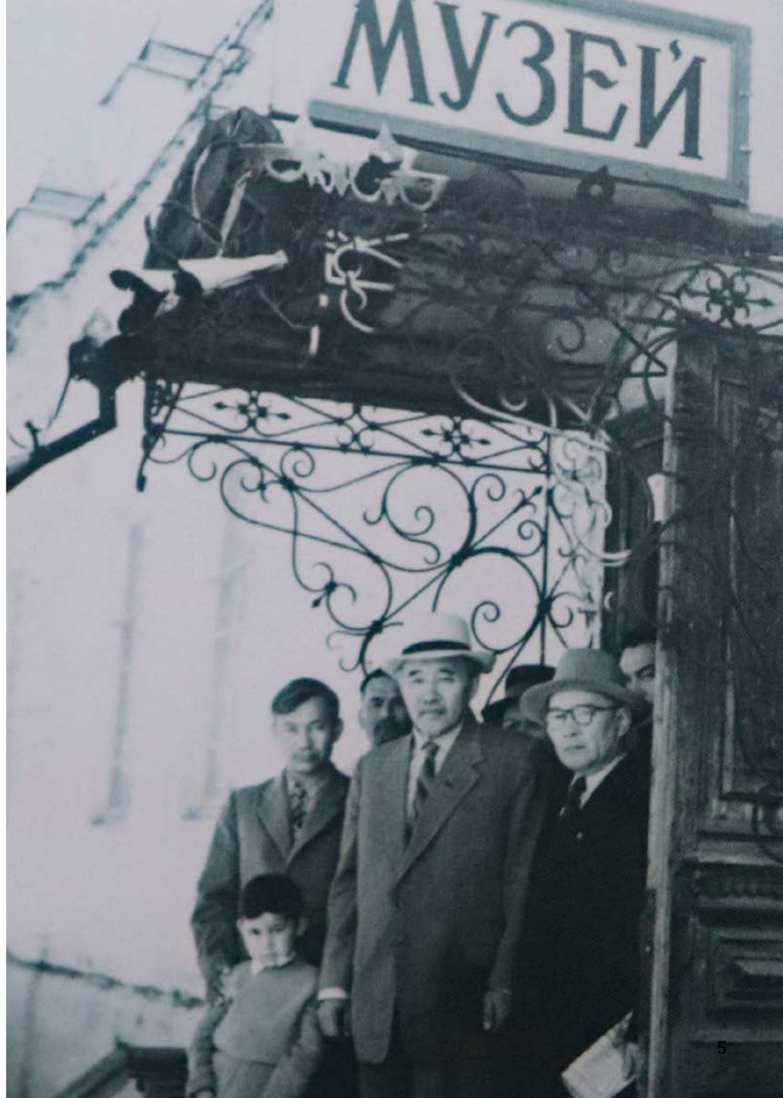
Посещение музея Мухтаром Ауэзовым 24 июня 1958 года