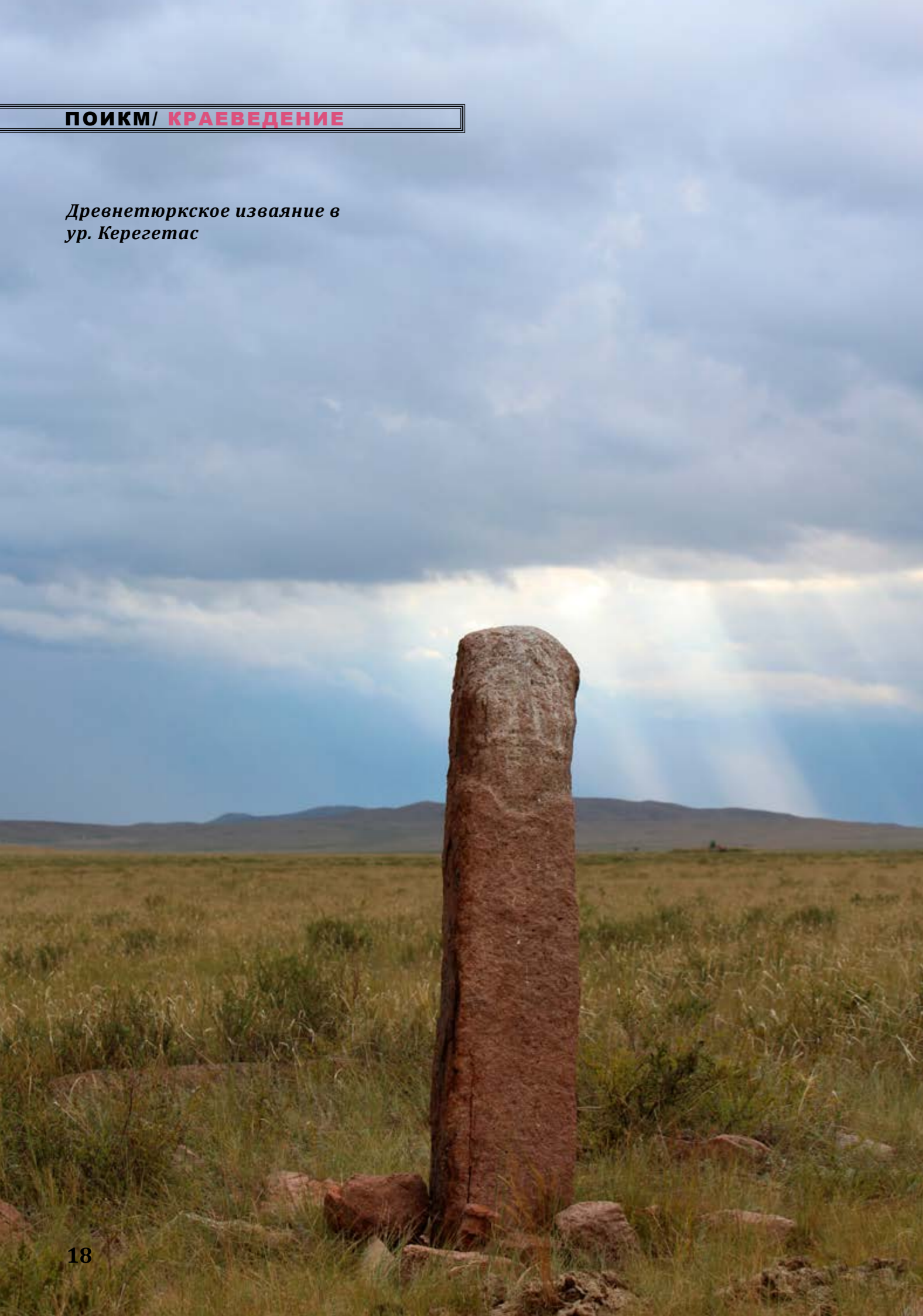
Древнетюркское изваяние в ур. Кергетас