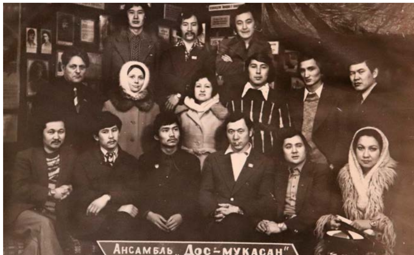
Ансамбль Дос-мукасан в музее, 1976 год