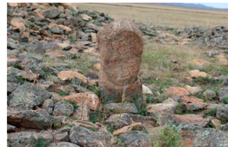
Малое изваяние комплекса Каракабак