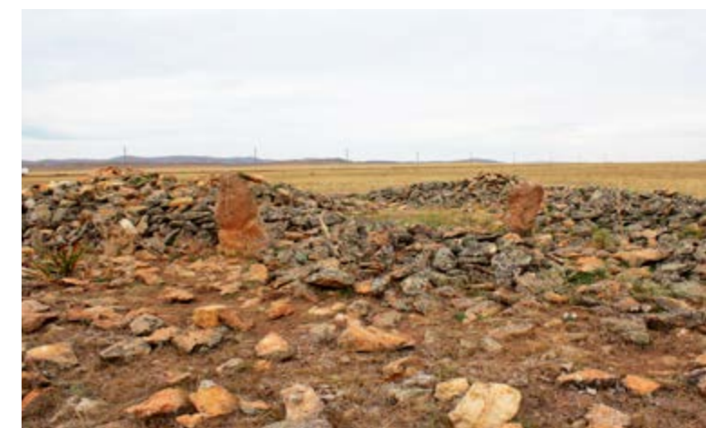
Поминальный комплекс Каракабак