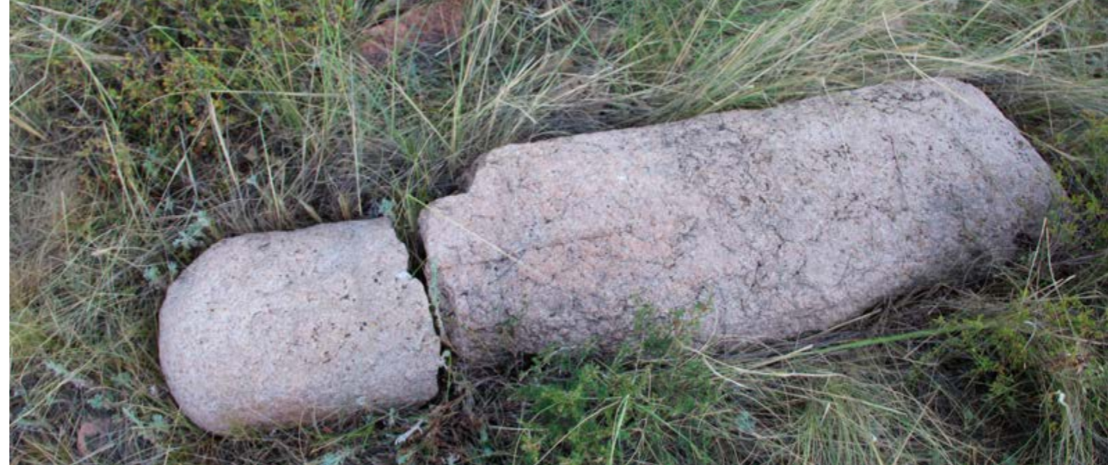
Разбитое изваяние комплекса Керегетас

Первые сведения о каменных изваяниях Павлодарского Прииртышья приводятся Н. Коншиным в работе «О памятниках старины в Семипалатинской области». Он пишет о двух курганах с каменными бабами в урочище Сары-оба. В ур. Жиланды три кургана возле которых стоят каменные бабы с изображениями лиц. Мелкие курганы разбросаны в Аккелинской волости. В ур. Джаманкуль, Джильтау, Жиланды и Бестобе есть много курганов, возле некоторых стоят каменные бабы с изображениями человеческого лица. По сведениям атамана Баянаульской станицы в 25 верстах от станицы в ур. Синтас есть три каменных бабы в рост человека. Рук и ног у баб нет, а высечены только головы с человеческим лицом.